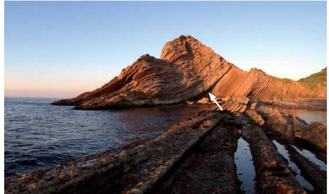
Límite Cretácico/Paleógeno en la cala de Algorri.