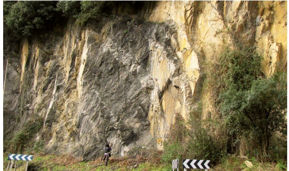
Errepide-bazterreko azalaramenduaren ikuspegi orokorra.

In situ edo zubiaz bestaldeko aparkalekua.