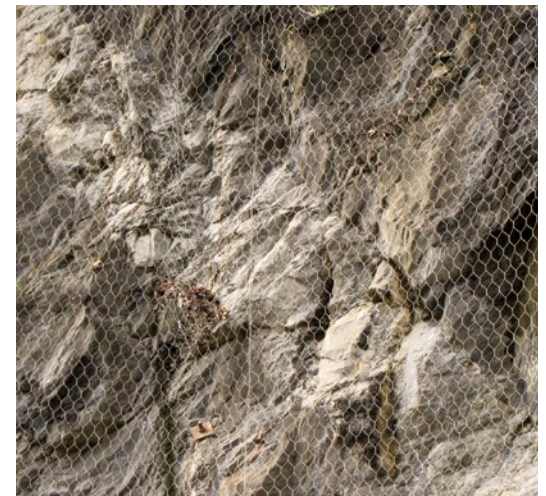
Eskistositatearen eragina tupetan eta kalkarenitazko geruza batean.