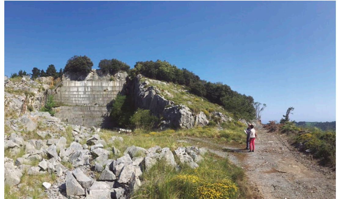
San Blas arrobiko ikupegoi orokorra.