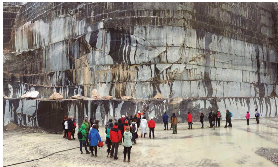
Lasturko harrobiko ustiapen-fronte nagusiaren ikuspegi orokorra.