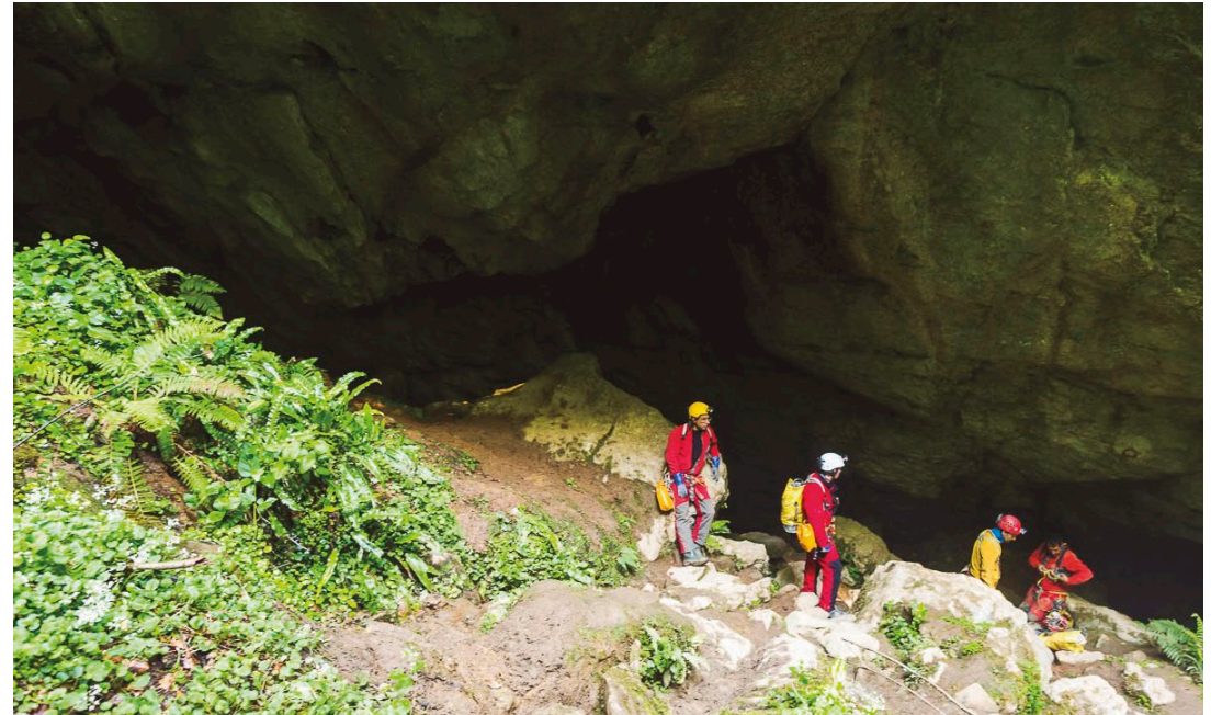
Aixa kobako sarrera ikusgarria.