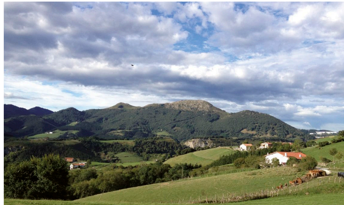
Andutz mendiaren ikuspegi orokorra, Elorriaga aldetik ikusita.