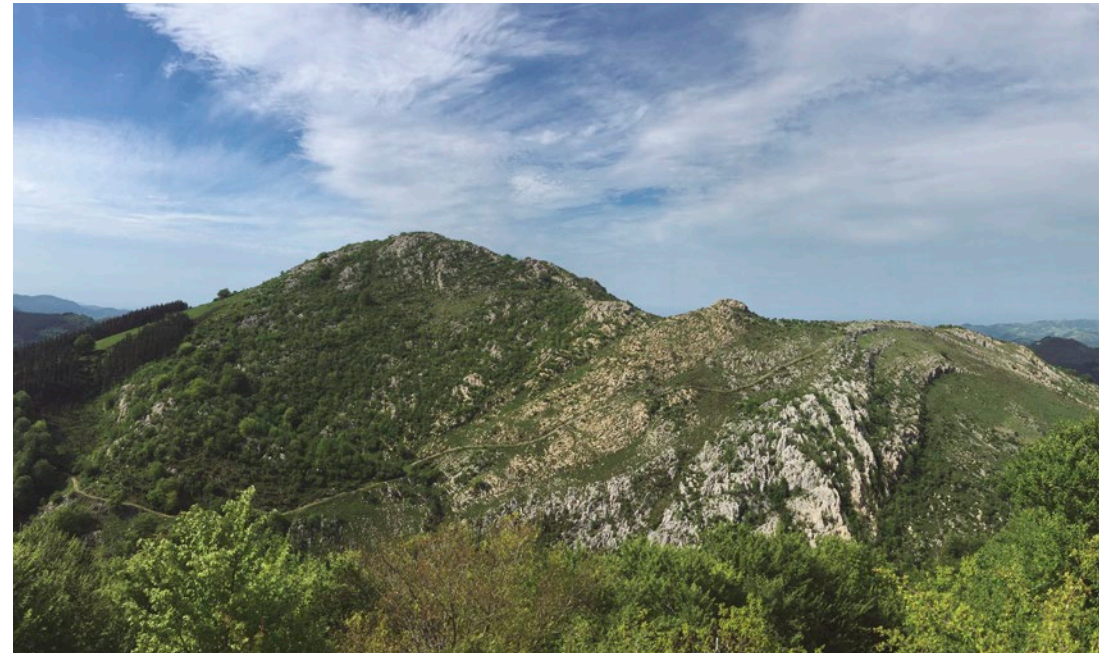
Sesiarte mendiaren eta antiklinalaren ikuspegi orokorra.