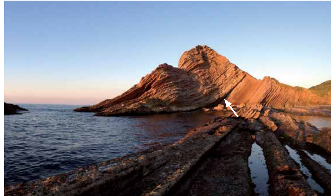
Mugaren eremua, itsasotik ikusita.