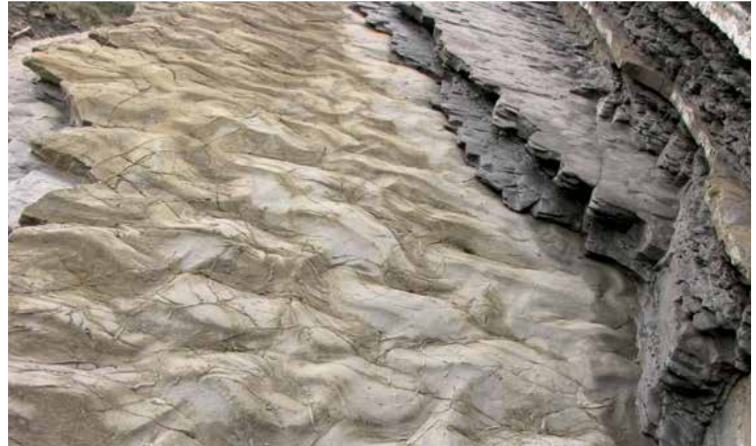
Aginaga formazioaren ikuspegi orokorra: turbidita asko ditu tartekatuta, eta haietan, aztarna fosilak daude.

In situ . Begiratokitik ikuspegi ederra dago, baina xafladurak eta aztarna fosilak gertutik ikusteko, ezinbestekoa da itsaslabarrera jaitea.