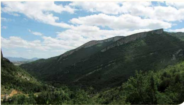
Panorámica de los crestones cretácicos y paleocenos dibujando el cierre meridional del anticlinal de Sobrón.