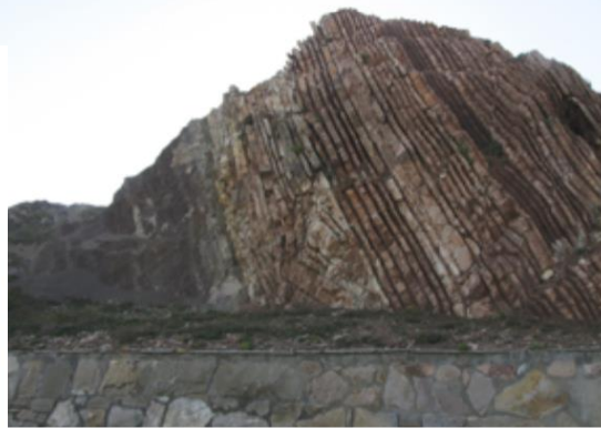
del límite K/T de Sopelana desde el paseo marítimo de la playa. El límite se vio litológico de margas a calizas. Se puede apreciar la ciclicidad estratigráfica.