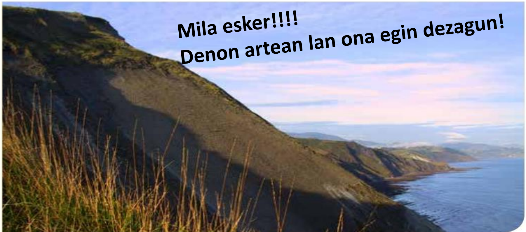
Panorámica de flysch arenoso del Cretácico Superior desde la zona de Pikote (Campaniense).

Mila esker!!!! Denon artean lan ona egin dezagun!