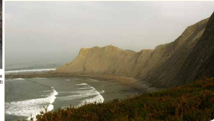
Panorámica de la sección de Sakoneta.a